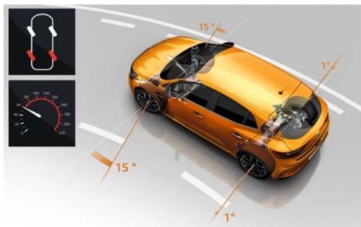
4CONTROL à plus de 60 km/h (plus de 100 km/h en mode RACE)

Des fondamentaux solides, présents au fil des générations